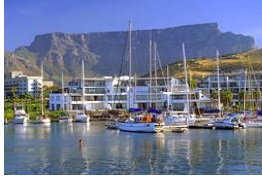
majestic Table Mountain