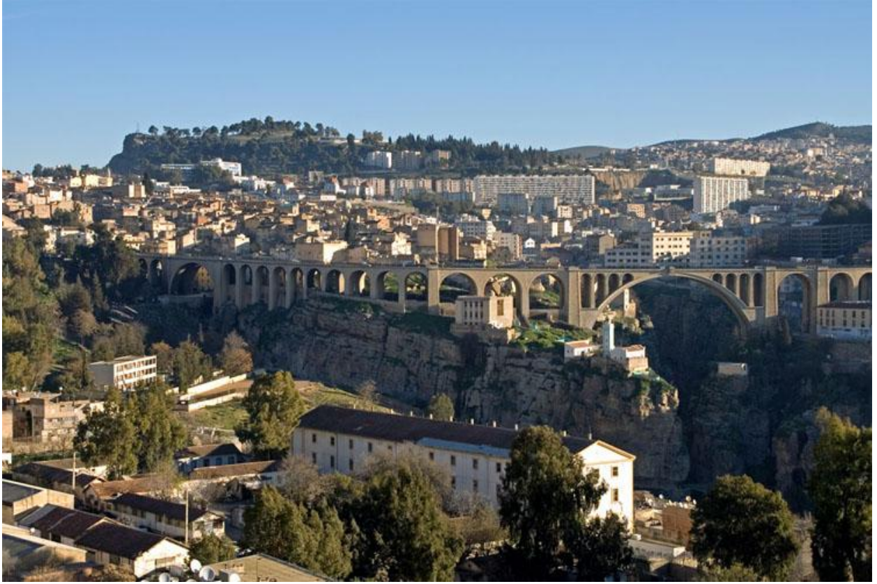
قسطنطينة، مدينة جزائرية يحبس جمال جسورها المعلقة الأنفاس