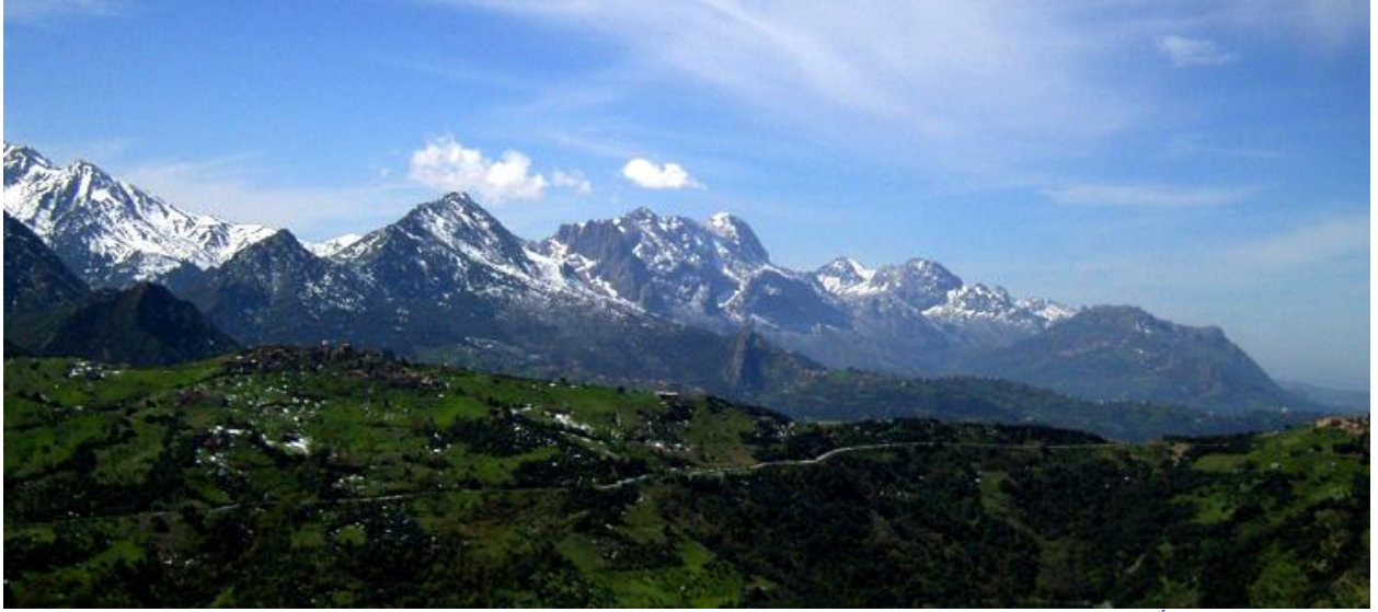
الجزائر: التلال والأراضي الخضراء