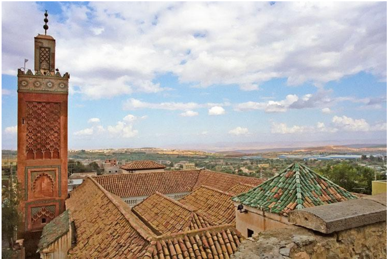
الجواهر الحسان في أخيار تلمسان