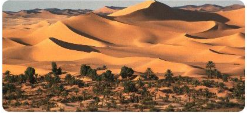
تيميمون.. واحة ساحرة في صحراء الجزائر