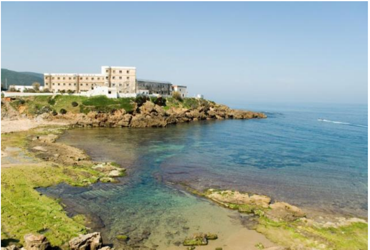
القالة تاريخ و ساحل و مرجان